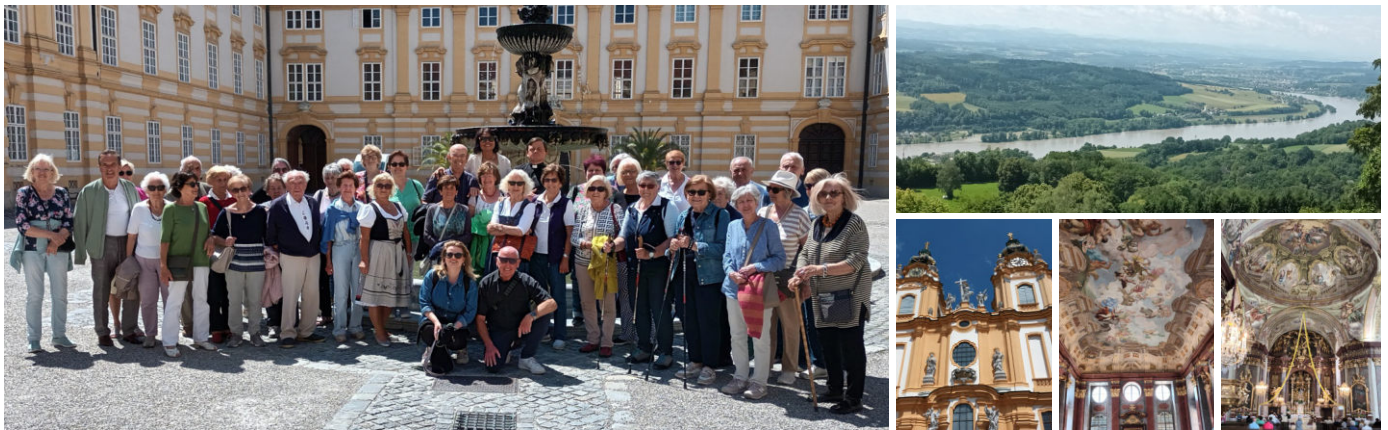
Die Senioren aus St. Christoph im Stift Melk