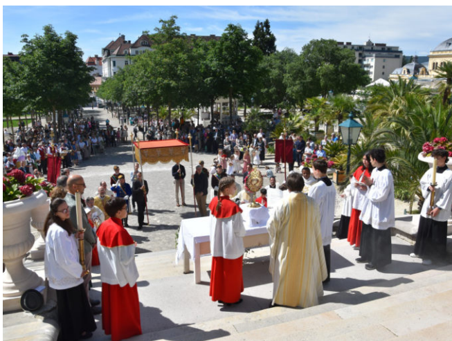
Der Altar im Kurpark

Für mich persönlich ist es immer wieder sehr schön, wenn der "Querschnitt unserer Glaubensgemeinschaften" in Frieden und Geschwisterlichkeit Spiritualität öffentlich leben kann - nicht nur, aber besonders eindrucksvoll zu Fronleichnam.