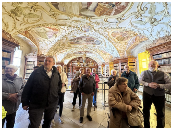
In der Bibliothek

Im 17. Jahrhundert wurde Lilienfeld zu einem regionalen Zentrum der Gegenreformation. Als Grundherrschaft hatte das Stift auch eine wichtige wirtschaftliche und verwaltungstechnische Rolle für die umliegende Region. Besonders eindrucksvoll ist auch die Bibliothek mit rund 40.000 Bänden. Eine Anekdote erzählt, dass eine russischsprachige Bibel 1945 die russischen Besatzer so beeindruckt hat, dass sie von einer Plünderung Abstand genommen haben. Nach der Führung stärkte sich die Reisegruppe im Klostergasthof mit einem Schnitzelmenü.