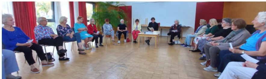
Blick in die Runde beim Einkehrtag

b) Unwissende lehren, Zweiflern raten, Trauernde trösten, Sünder zurechtweisen, jenen, die Leid zufügen, verzeihen, Lästige ertragen, für alle beten