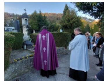
Gedenken beim Mahnmal für die Gefallenen und Heimatvertriebenen des 2. Weltkrieges