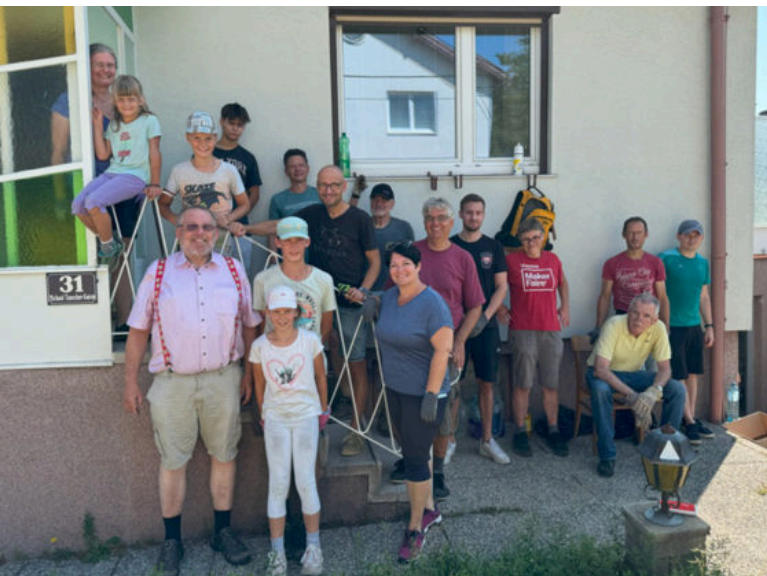
Viele fleißige Hände bei der Räumung des Kupferschmied-Hauses