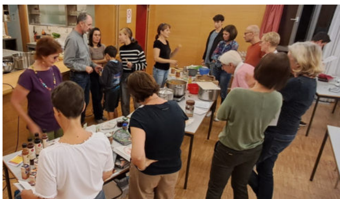
Kochworkshop in St. Christoph