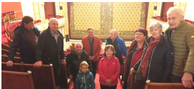
Ausflug nach Berndorf