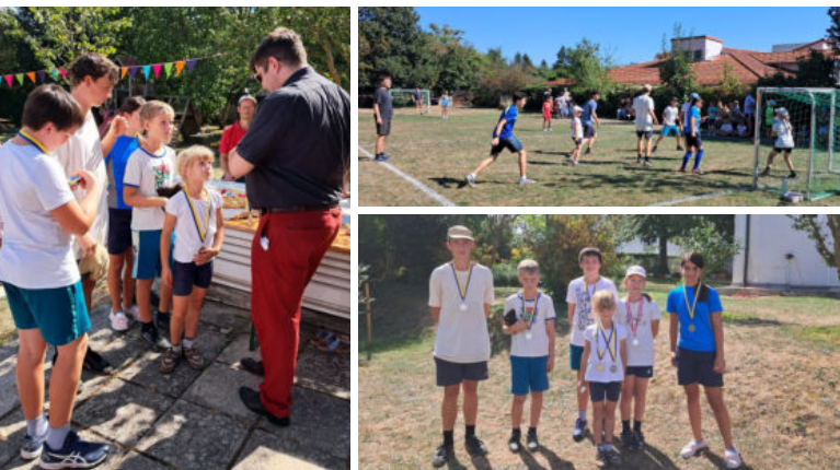
Voller Einsatz der jungen Fußballbegeisterten!

Am 8. September wurde in St. Josef wieder ein wunderbares Familienfest gefeiert, zu dem auch die umliegenden Pfarren eingeladen waren.