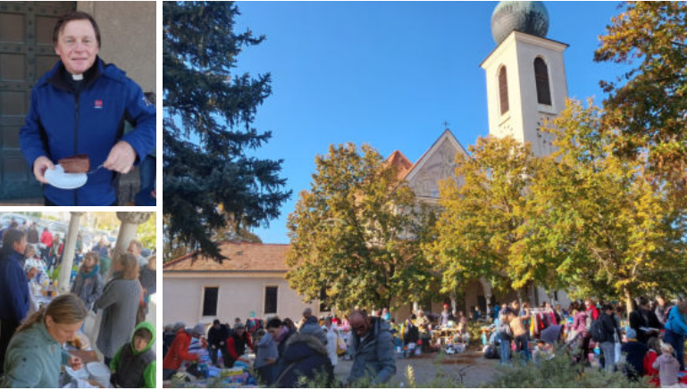
Kindersachenflohmarkt am 12. Oktober