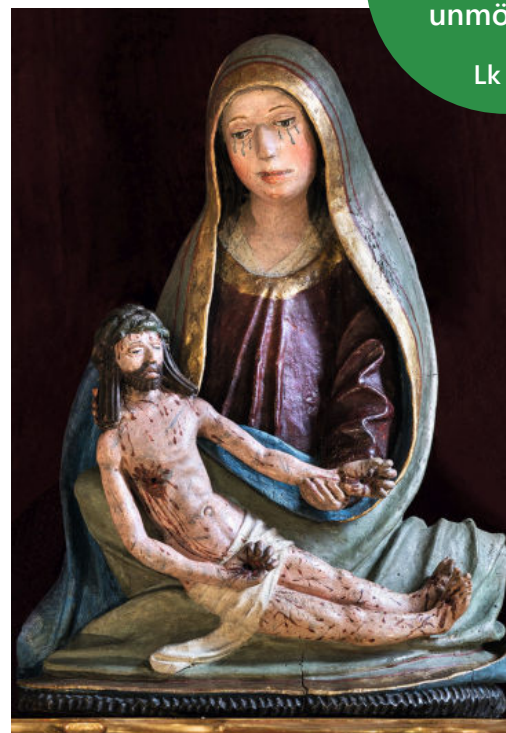
Meine Lieblingsdarstellung von Maria: Gnadenbild von Maria Luggau Spätgotische Pietà 1513

Was an Maria noch deutlich wird, ist die Allmacht Gottes. Für Gott sind Dinge möglich, die vom Verstand her unmöglich sind. Aber er ist nicht wie andere Götter, in deren Beziehungen zu den Menschen meist Gewalt, Zerstörung und Betrug vorherrschen. Während zum Beispiel der Göttervater Zeus die wunderschöne Europa, in die er sich verliebt hat, einfach entführt, respektiert Gottes Allmacht die Freiheit der Menschen - auch auf die Gefahr hin, dass diese ihn ablehnen oder nichts von ihm wissen wollen. Wenn wir zu Weihnachten wieder Maria und Jesus in die Krippe